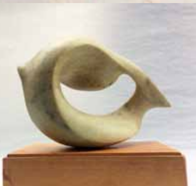
Gerhard Helmers: Meereslied